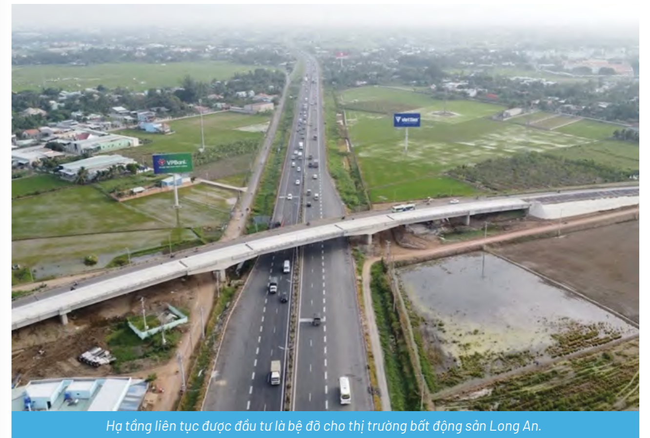
Hạ tầng liên tục được đầu tư là bộ đồ cho thị trường bất động sản Long An.