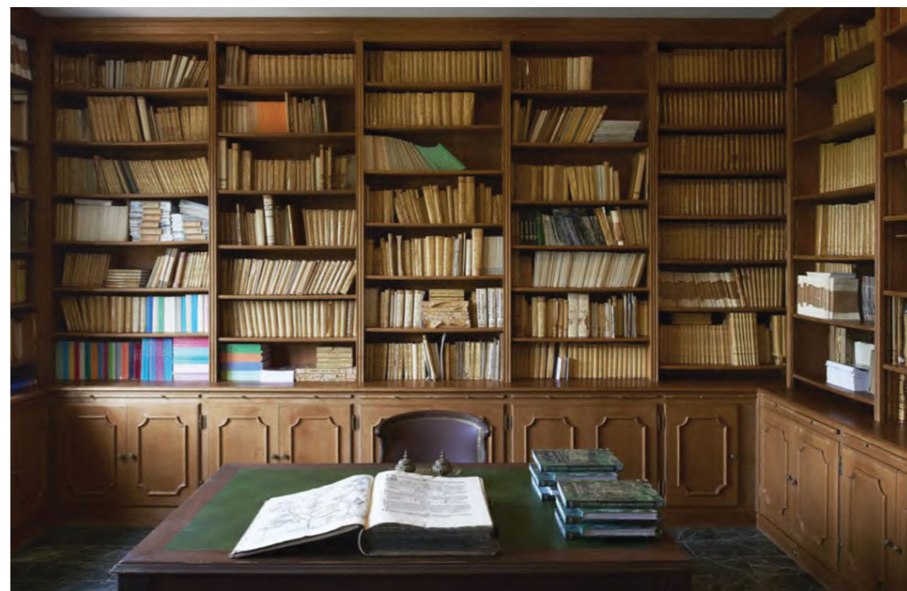
Thư viện có 3.000 cuốn sách về tự nhiên và thực vật