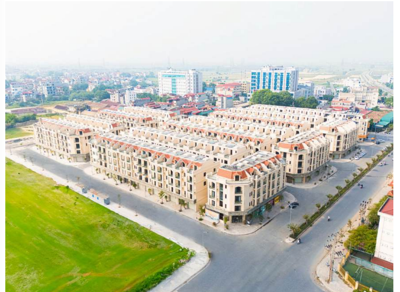
Hưởng lợi từ quy hoạch lên quận 2030, Thường Tín trở thành điểm đến hoàn hảo với các nhà đầu tư

Sự ra đời của các khu đô thị kiểu mẫu được xem là tất yếu, đáp ứng nhu cầu sở hữu không gian sống cho người dân địa phương cũng như hiện đại hoá bộ mặt đô thị nơi đây.