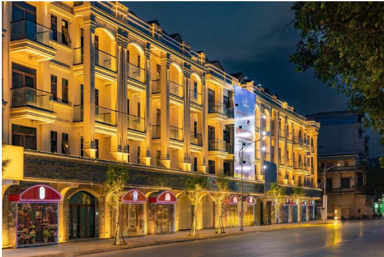
Him Lam Thường Tín hứa hẹn trở thành điểm sáng thay đổi bộ mặt đô thị cửa ngõ phía Nam Thủ đô

gắn liền với đất cho khách hàng. Điều này cho thấy Him Lam Thường Tín không chỉ là “chìa khóa” đầu tư đắc thắng mà còn là tài sản kế thừa được bảo chứng gia tăng giá trị và giàu tiềm năng bậc nhất khu vực.