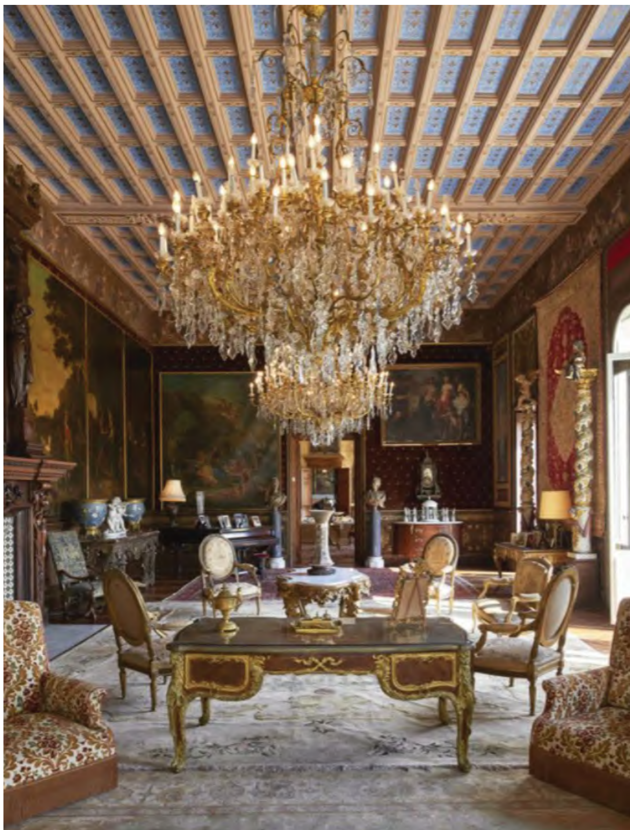
Phòng khách nhắc nhở về chủ nhân cũ, đặc biệt là vua Leopold II, với dấu hiệu xanh và vàng được gắn trên một trong những bức tường phủ bằng lụa. Những bức chân dung Blanche Delacroix người tình không mấy khả kính của Leopold II, một vũ công của quán cà phê cũng được treo ở đây. Các lò sưởi khổng lồ bằng đá cẩm thạch cao hơn 3m.