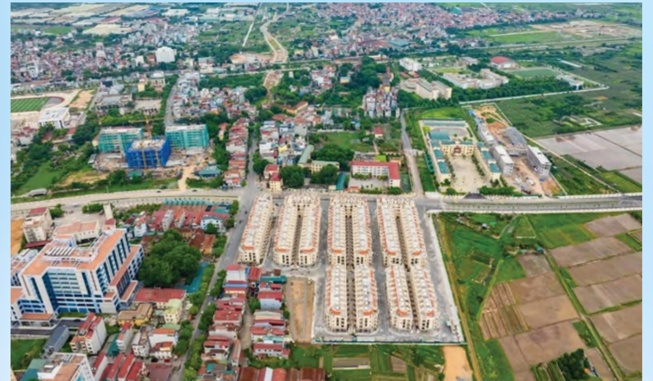
Đường vành đai 4 vùng thủ đô mở ra đến đâu, giá bất động sản tăng theo đến đấy.

Không ít người mua ở thực và nhà đầu tư đang đẩy nhanh tốc độ quyết định mua nhà vì lo ngại giá sẽ tăng khi thị trường ngắm các chính sách từ các luật liên quan bất động sản có hiệu lực.