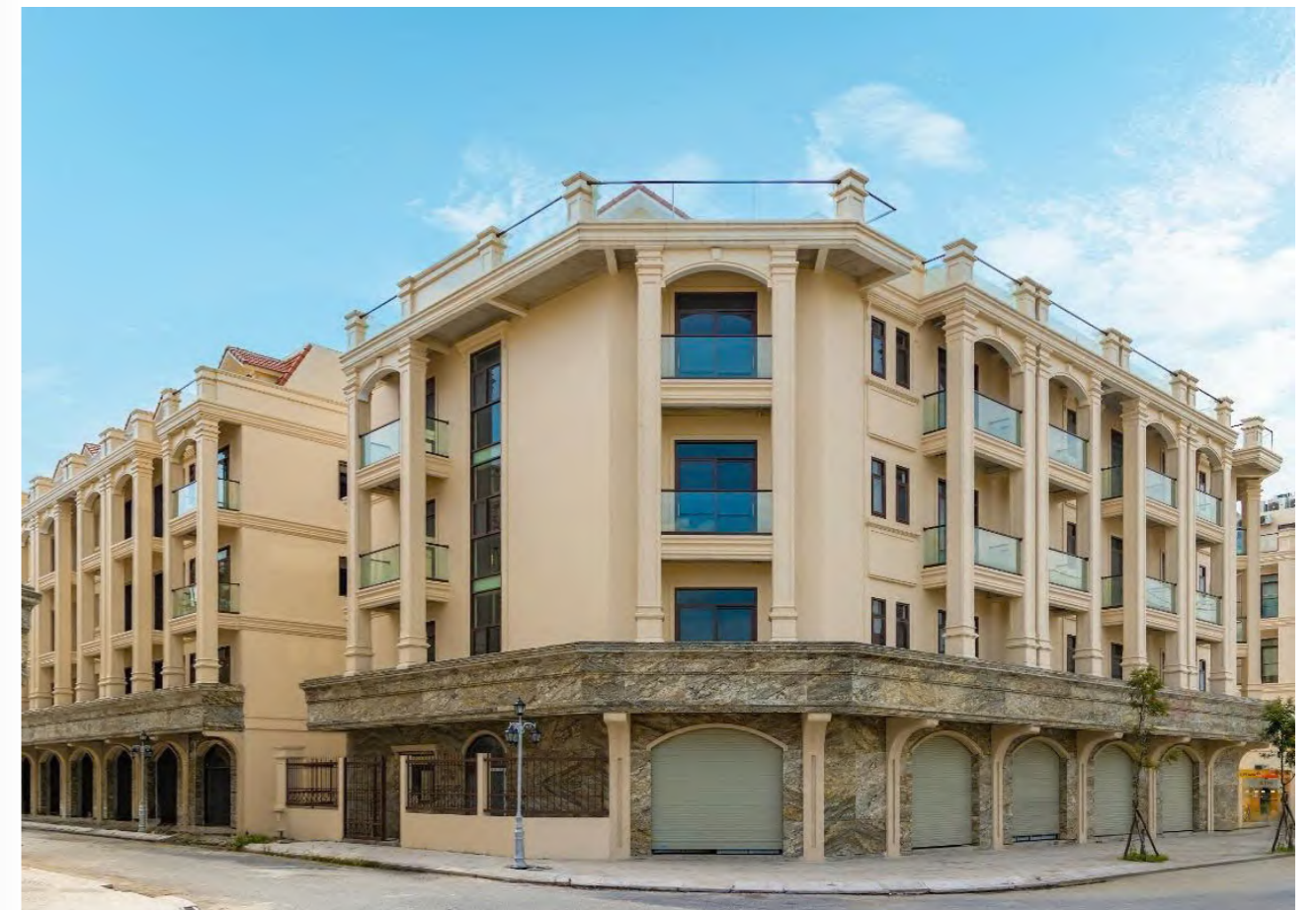
Hội tụ nhiều ưu thế vượt trội, Him Lam Thường Tín là điểm đến lý tưởng cho khách hàng và giới đầu tư

Thêm vào đó, với vị trí tiếp giáp tuyến đường vành đai 4 trong tương lai sẽ giúp kết nối Him Lam Thường Tín với các tỉnh Hà Nam, Hưng Yên, Nam Định, Ninh Bình... nhanh chóng và thuận tiện hơn, giúp giảm tắc nghẽn giao thông và góp phần nâng tầm giá trị bất động sản nơi đây.