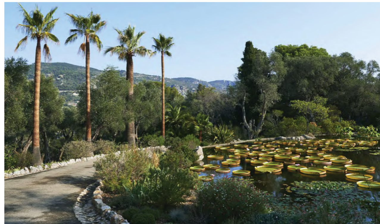
Một trong những giá trị độc đáo nhất của khu vườn là 14.000 loài thực vật. Đây là một trong 10 khu vườn thực vật hàng đầu trên thế giới. Không giống với những nơi khác, đây là vườn tư nhân nhưng nó đủ sức cạnh tranh với những khu vực thuộc sở hữu của các thị trấn và trường đại học.