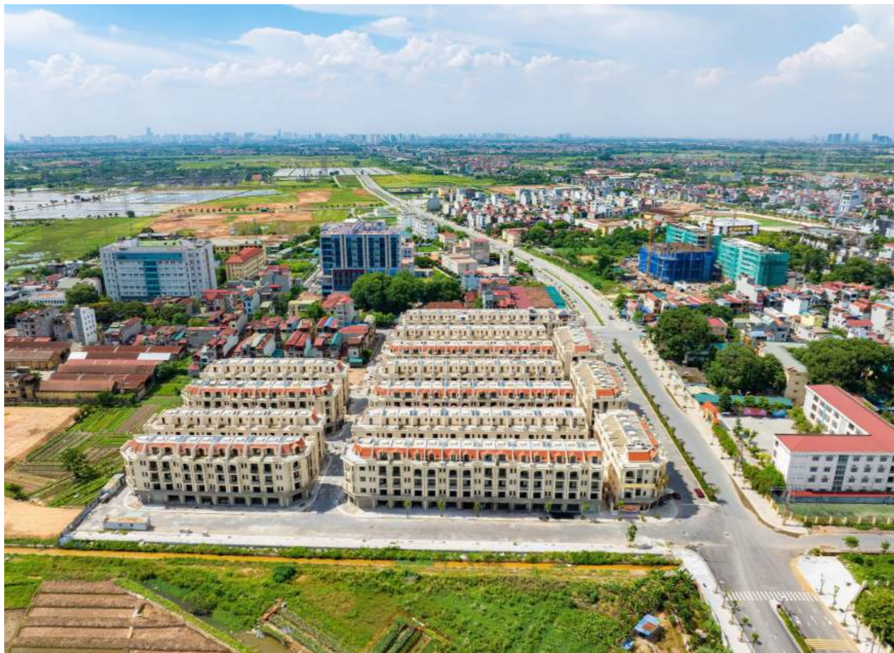
Him Lam Thường Tín là dự án hiếm có được quy hoạch đồng bộ và bài bản tại cửa ngõ phía Nam thủ đô